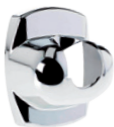
Plate-cover assembly with chrome finish